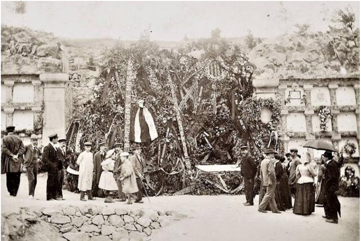
Corones de flors davant la tomba de Jacint Verdaguer al cementiri del Sud-Oest de Montjuïc. Enterrament, 13 de juny de 1902.