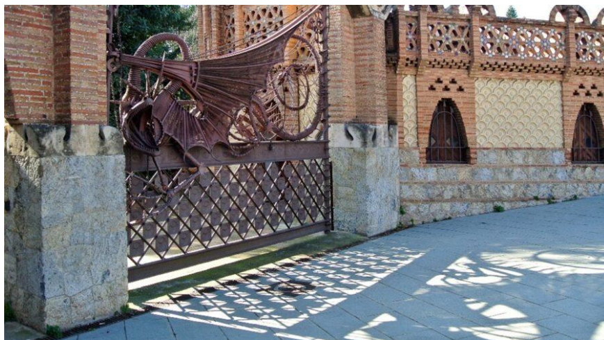
La porta del Drac al Palau Güell de Pedralbes (les Corts de Sarrià).

El primer encàrrec de Güell a Gaudí va ser el pòrtic d'entrada a una finca de diverses portes, en destaca la principal amb una reixa de ferro en forma de drac, amb ulls de cristall; aquesta figura representaria Ladó, el drac guardià del Jardí de les Hespèrides, vençut per Hèrcules en el seu onzè treball, episodi que narra Jacint Verdaguer en el seu poema L'Atlàntida en què podem percebre el possible origen de la figura d'entrada als pavellons.