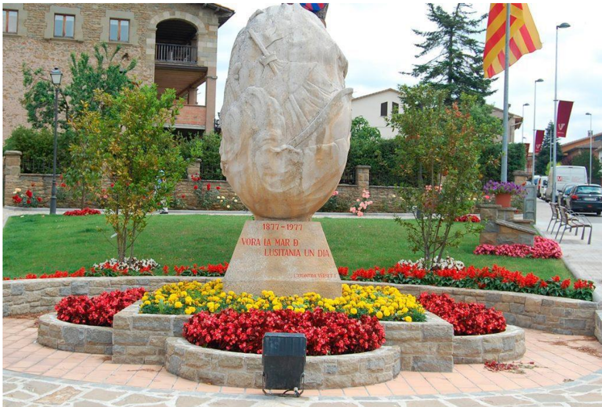
Monument a l'Atlàntida a Folgueroles

“Situat a l'entrada del poble, erigit el 1977, en commemorar-se el centenari de la publicació de L'Atlàntida , de Jacint Verdaguer .