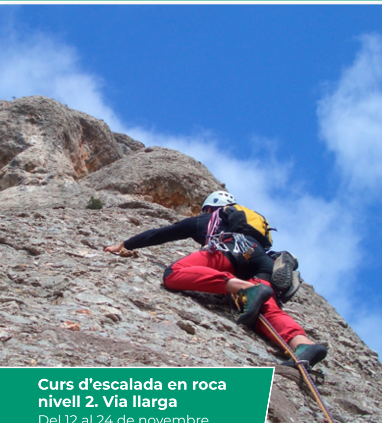
Curs d'escalada en roca nivell 2. Via llarga Del 12 al 24 de novembre.