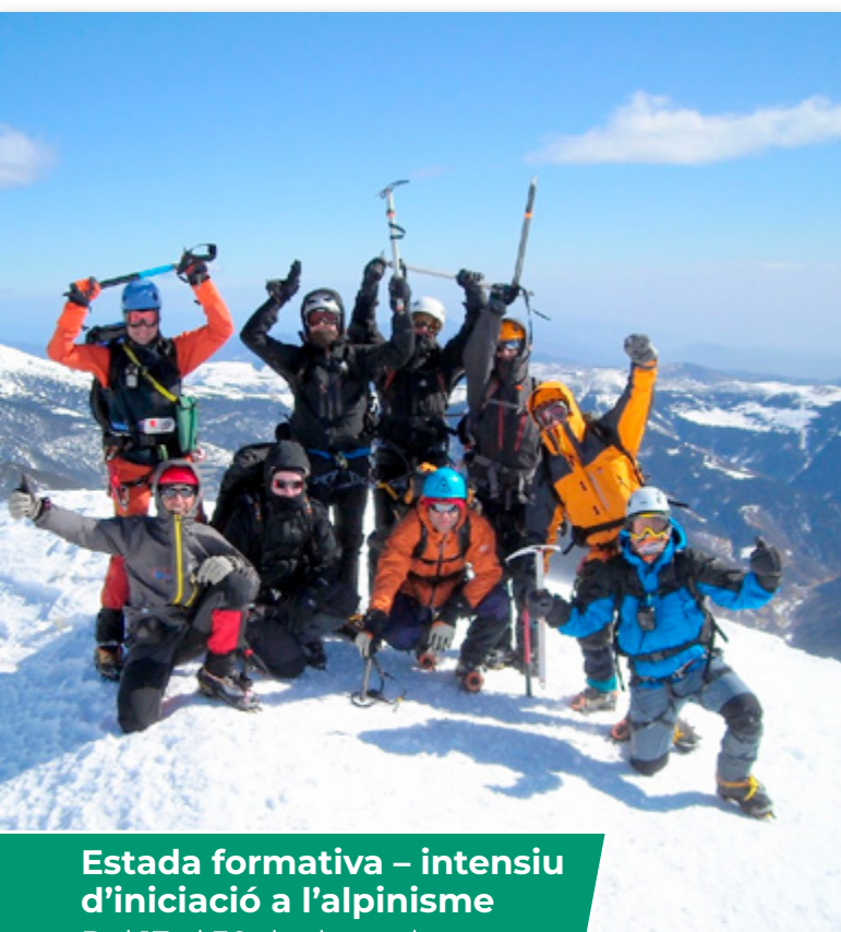
Estada formativa – intensiu d'iniciació a l'alpinisme Del 17 al 30 de desembre.