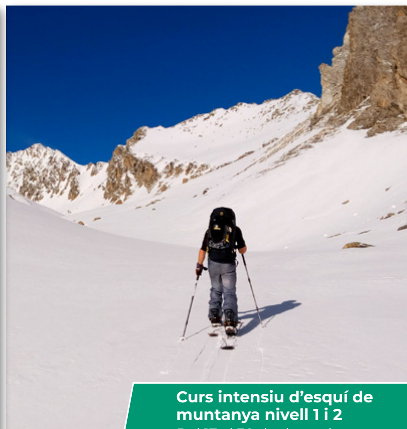
Curs intensiu d'esquí de muntanya nivell 1 i 2 Del 17 al 30 de desembre.